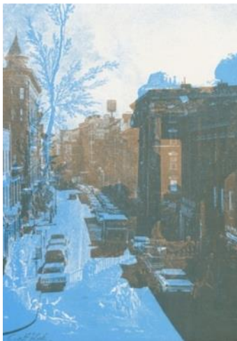
左：チェン・ウェイ 《New Station - if on a winter's night》2020 年 © Chen Wei, courtesy of Ota Fine Arts