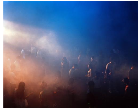
チェン・ウェイ 《IN THE WAVES #5》2013年 東京都写真美術館蔵