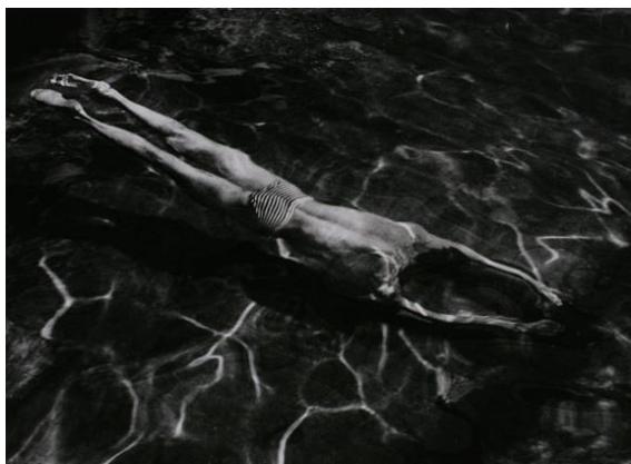
アンドレ・ケルテス 《水面下の泳ぐひと、エステルゴム、ハンガリー 1917 年》1917 年